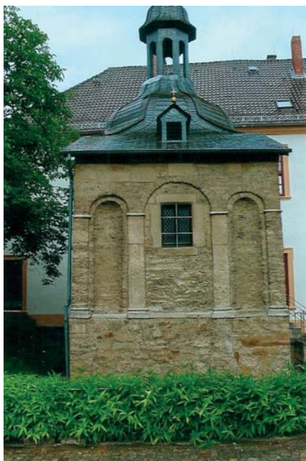
Капліца святога Пятра і святога Яна ў кляштары святога Людгера. Хельмштэdt.

У пачатку верасня 1046 года ў Бамберг конна прыязджае ганец. Ён перадае біскупам ліст. Генрых III выклікае ў паход у Рым. Ён хоча, каб Папа Рымскі каранаваў яго імператарскаю каронаю. Магутных людзей імперыі выклікаюць на зборы ў Аўгсбург. Суітгер ад'язджае, яго суправаджае Гунтрам, ягоны