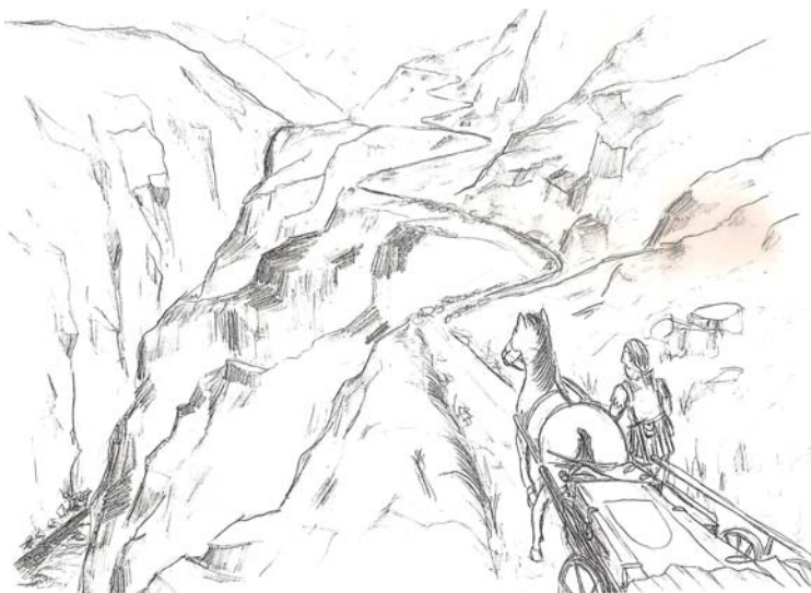
Цела папы Клімэнта II перапраўляюць цераз Альпы. Мастак Макс Котт.

Манах Гунтрам, паплечнік і верны суправаджальнік Суітгера, рыхтуе перавозку цела. Абат кляштары Сан-Тамаза патрабуе сэрца мёртвага Папы, ягоныя лёгкія і ягоную кроў. У капліцы рыхтуюць магілу і ўрачыста хваюць унутраныя органы. Цела мыюць у травяной ванне. Грудзі, жывот і ўсё ўнутры напаўняюць пакуллем. Нос, задні праход, рот і вушы напіхваюць міраю, ладанам, алоэ, а горла напаўняюць рознымі вострымі травамі. Пасля гэтага цела добра выціраюць і ўціраюць у скуру бальзам. Пасля таго як усе часткі цела з галавы да ног туга абгорнутыя ў прамочаныя воскам тканіны, усё цела ўпрыгожваюць папскім адзеннем і, як мае быць, кладуць у труну.