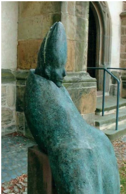
Бронзавая скульптура папы Клімэнта II (скульптар Сабінэ Хоппэ) перад пратэстанцкаю царквою ў Хорнбургу.